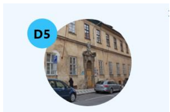
Obrázek 3. Pavilon D5 (Radiodiagnostická klinika)