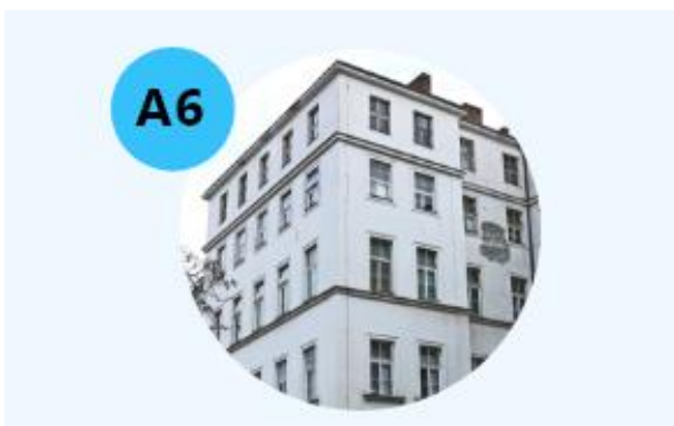
Obrázek 2. Pavilon A6 (I. Klinika tuberkulózy a respiračních nemocí)