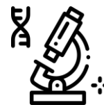
Vyšetření vzorků v laboratoři